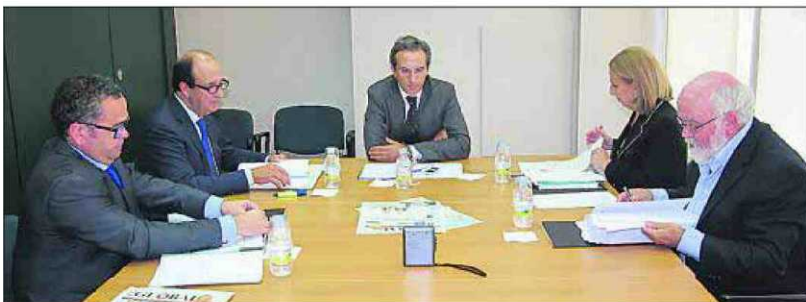
Uno de los problemas que los profesionales encontraron a la PPA fue que dificultaba la continuidad de los tratamientos con las mismas presentaciones ya que, según Naveda, podría causar problemas de adherencia a la terapia.